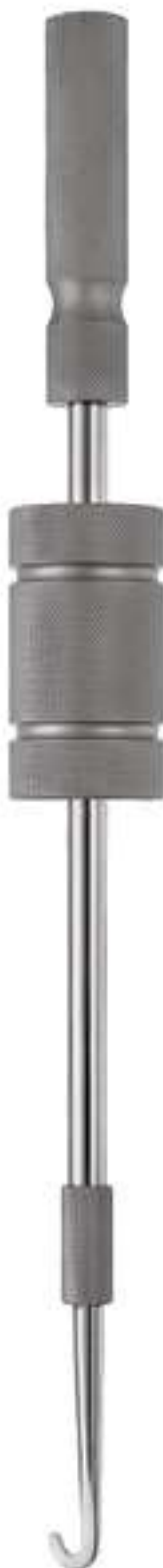
75.66.08 Extraktionsinstrument Extracting instrument Instrumento para extracción Instrument pour extraction Strumento per estrazione