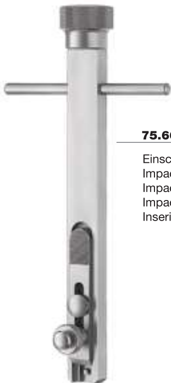
75.66.07 Einschläger/Ausschläger Impactor/extractor Impactor/extractor Impacteur/extracteur Inseritore/estrattore